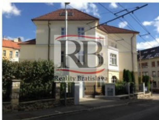
Príjazd zo Sulekovej ulice